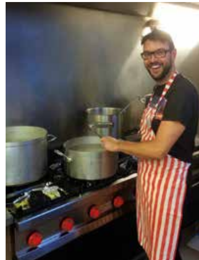
Helpen koken in de klas