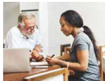
Breng een bezoek aan de school en stel veel vragen