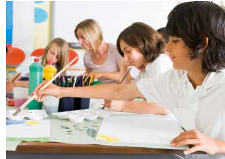
Helpen knutselen in de klas