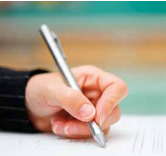
Schrijf op tijd in

In principe moet de school je kind inschrijven. Het kan wel dat de school te weinig plaats heeft. Dan moet de school je een attest meegeven. Dat attest heet 'Mededeling van niet-gerealiseerde inschrijving'. Een voorbeeld van dit attest vind je achteraan in dit boekje op pagina 30. Je moet dan een andere school zoeken.