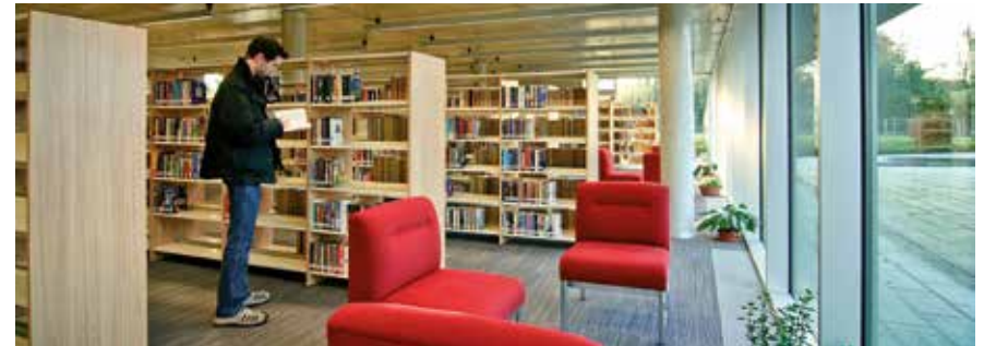
Ga naar de bibliotheek