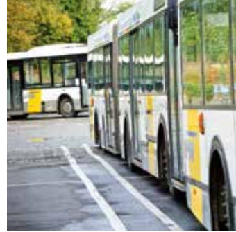
Met de bus naar school?

www.onderwijskiezer.be www.ond.vlaanderen.be