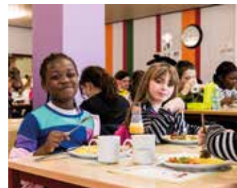
Eten tijdens de middagpauze