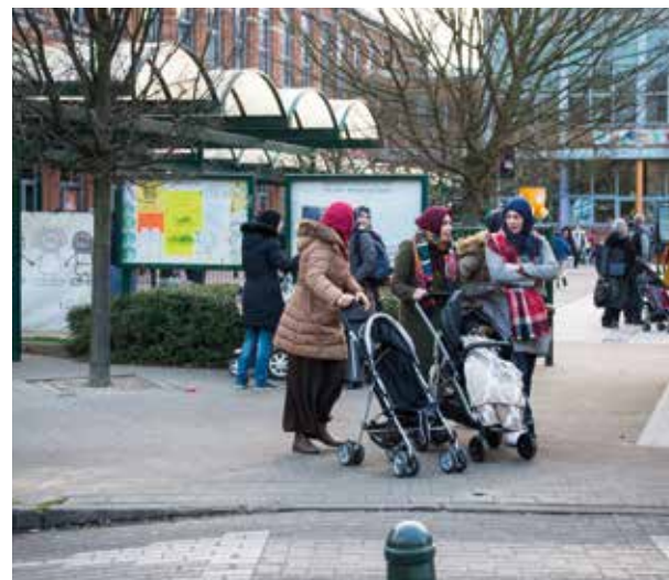
Spreek andere ouders aan