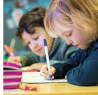
Leren in de klas