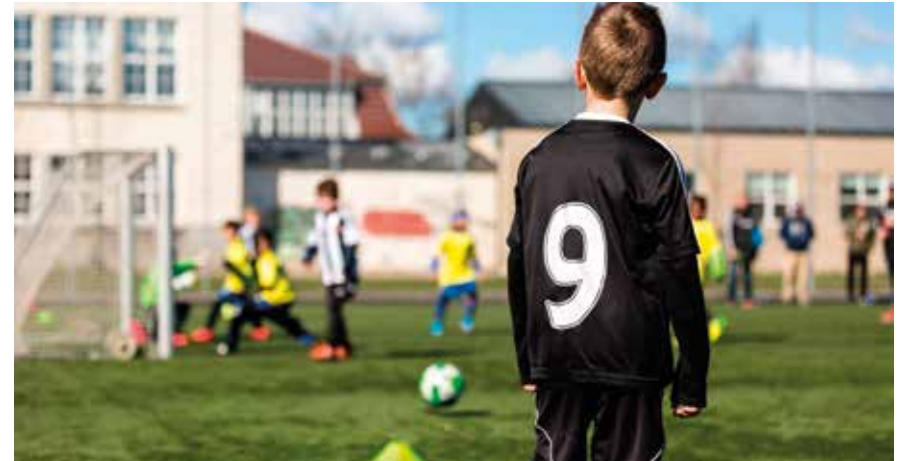
Schrijf je kind in bij een Nederlandstalige sportclub of vereniging