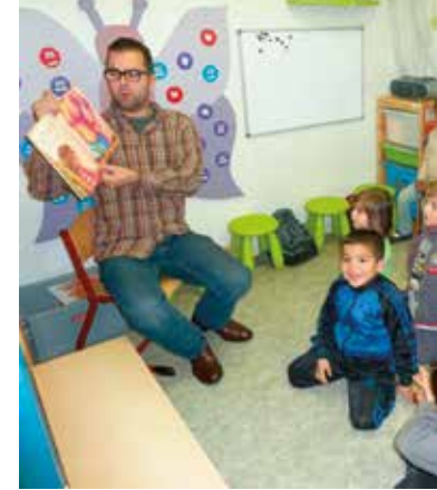
Voorlezen in de klas