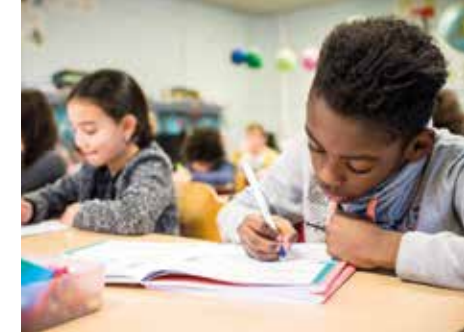
Schrijven in de klas