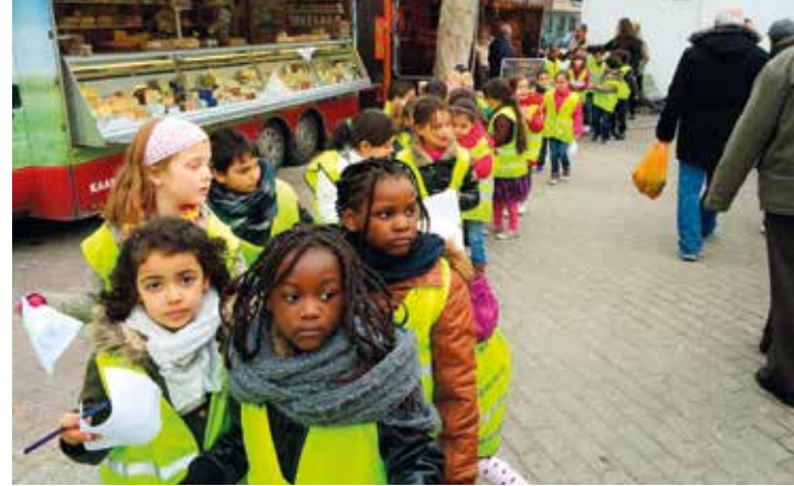
Meegaan op uitstap

Kijk elke dag in de boekentas van je kind. Je zal vaak een briefje vinden met de vraag om te helpen. Probeer hier af en toe tijd voor te maken. Het is leuk voor je kind en je leert zelf de school beter kennen.