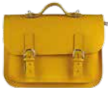
Rugzak of boekentas