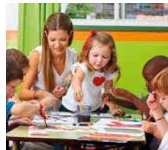
Opvang voor en na de school