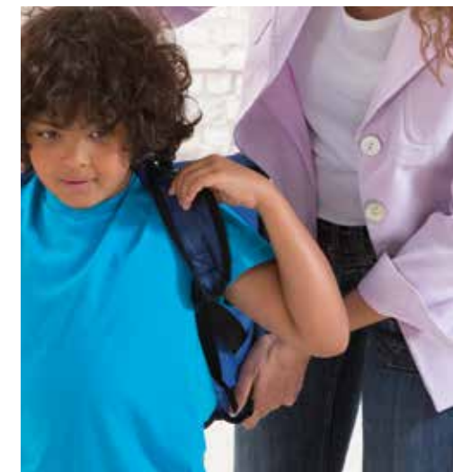
Kijk elke dag in de boekentas