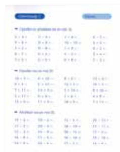
Rekenen in de klas

Als je kind ouder wordt, zal het meer huiswerk hebben.