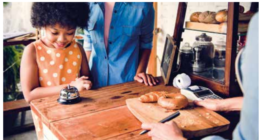
Laat je kind zelf een brood bestellen bij de bakker