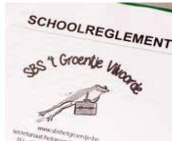
Wat zijn de afspraken in het schoolreglement?