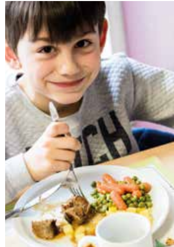
Kan mijn kind warm eten op school?