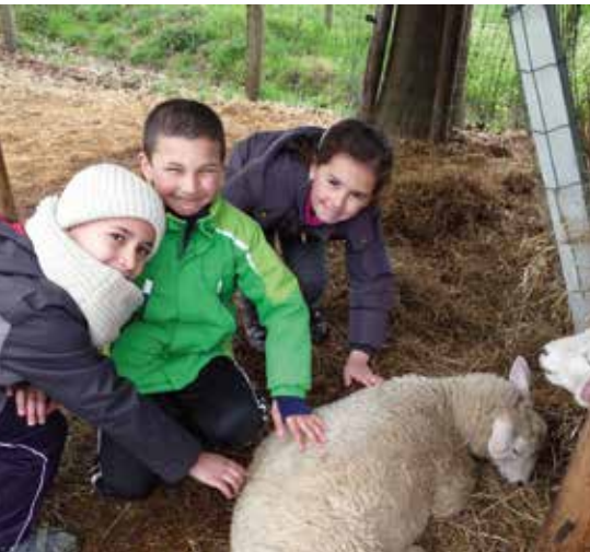
Uitstap met de klas