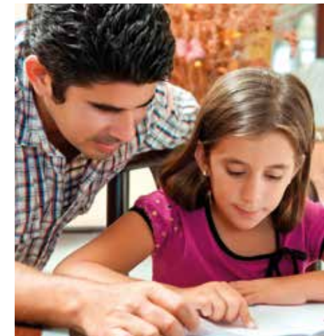
Helpen met het huiswerk