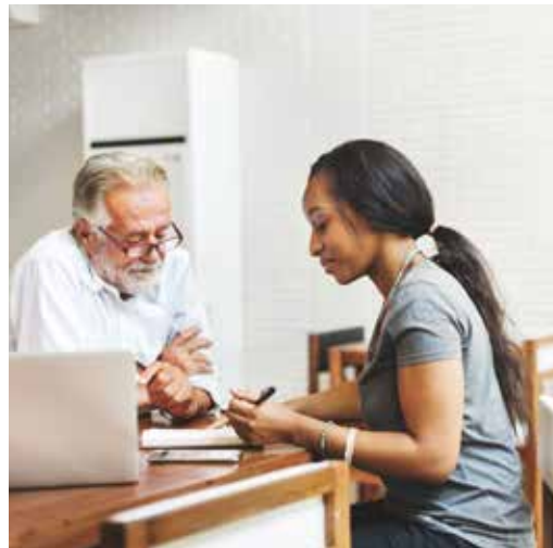
Kan je de factuur niet betalen? Bespreek dit met de directeur van de school