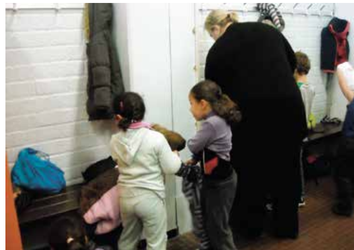
Helpen aan- en uitkleden bij het zwemmen