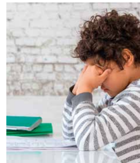
Wacht niet met het huiswerk tot je kind bijna moet gaan slapen