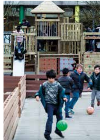
Buiten spelen tijdens de speeltijd